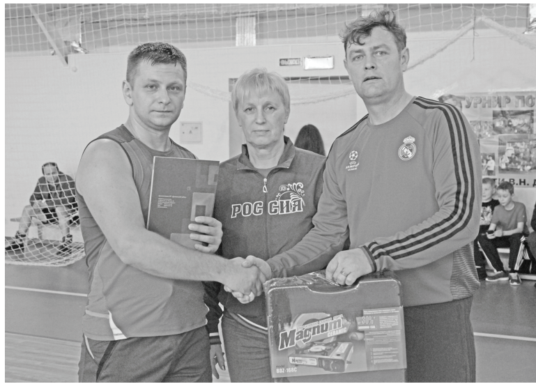
Награды — лучшим игрокам.

Организаторы всегда накрывают чайный стол, чтобы люди могли подкрепиться. И в этот раз все с удовольствием ели и нахваливали наши местные продукты — сыр от Торгового дома «Хотьково», булочки с разными начинками, испеченные на пекарне ООО