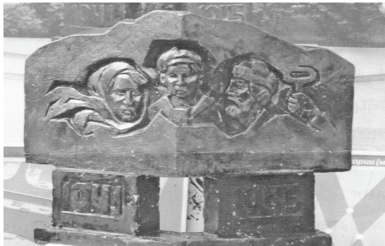
Эскиз памятника труженикам тыла, который планируется установить в Думиничах.

Итак, ветераны решение поддержали. Приглашаем к обсуждению всех думиничан. Выказать свое мнение – поддерживаете ли вы проект установки памятника тру-